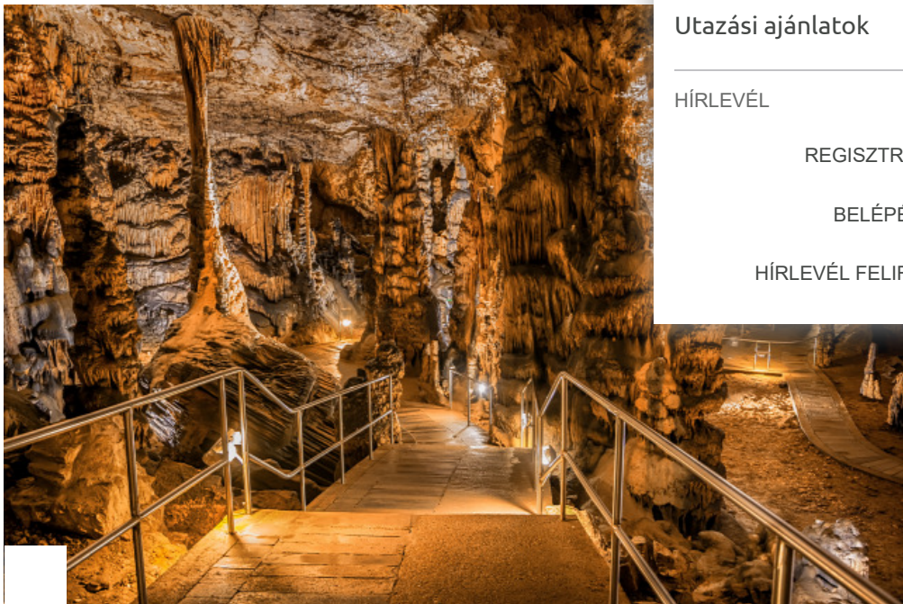
A Baradla-barlang

Három évszakban, a téli, nyári és őszi időszakban is lezajlottak próbaterápiás kezelések, írják az Aggteleki Nemzeti Park Igazgatóság weboldalán, amely egyben azt is jelenti, hogy hamarosan hivatalosan is gyógyhellyé nyilváníthatják hazánk egyik leghíresebb barlangját, a Baradlát.